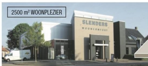
RIVERDALE inspiratie shop

Iedere vrijdag schnitzeldag Alle schnitzels voor slechts € 9,50