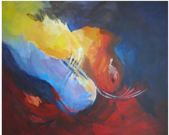
“Red, Yellow and Blue” 3